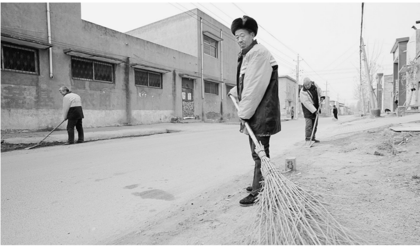
观音寺镇十里铺村的保洁员正在打扫卫生。

“保洁员也竞争上岗？”是的，你没听错，现如今新郑市观音寺镇的102名保洁员，全都是“真枪实弹”锤炼出来的“保洁精英”。这不，保洁员队伍重新选聘、竞争上岗工作，有条不紊地开展起来。