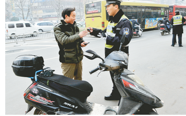
昨日,民警在嵩山路上对骑电动车闯红灯者进行身份登记、拍照记录,并对其进行安全教育。