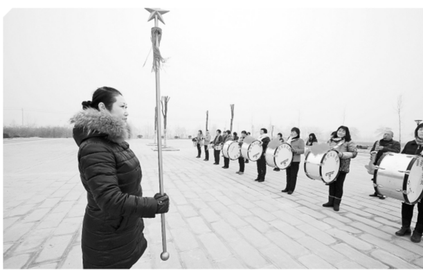
辛店镇加大投入,不断丰富群众文化生活。