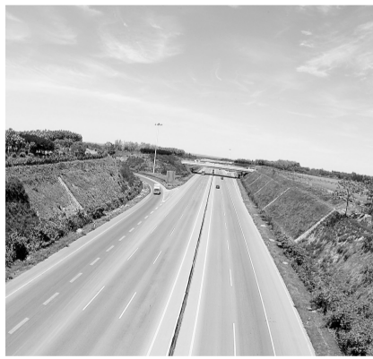
辛店镇交通便利,郑尧高速穿越而过。