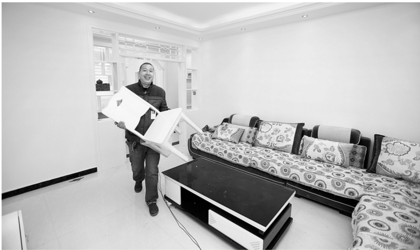
村民搬新家,心里乐开花。