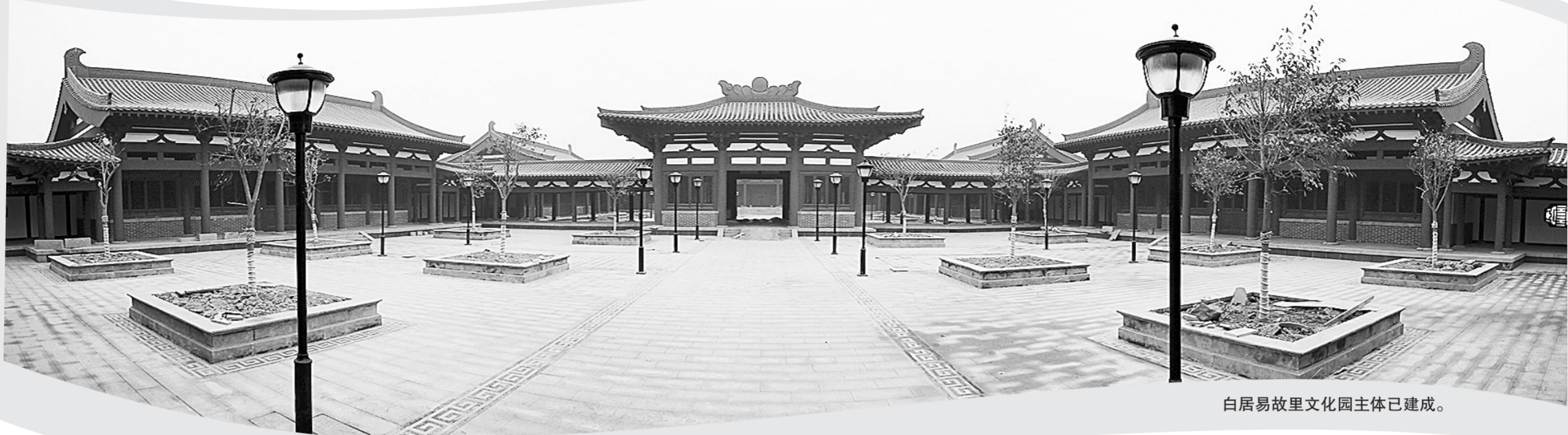
白居易故里文化园主体已建成。