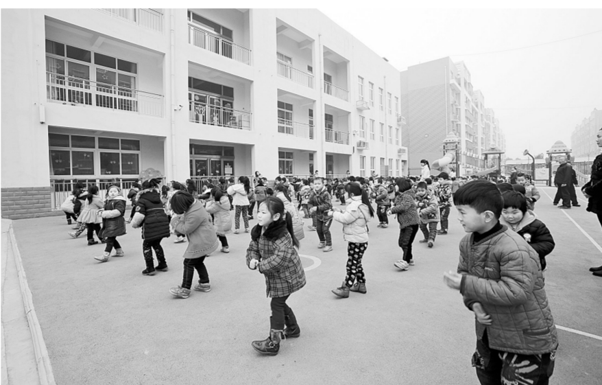
辛店镇各新型社区基础设施完善,幼儿园、卫生室等设施一应俱全。