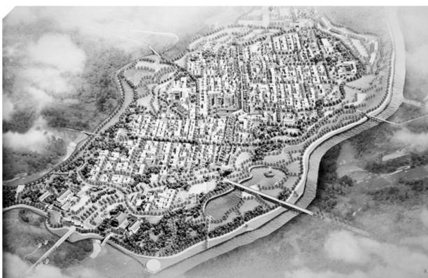
人和寨古村落保护工程效果图。