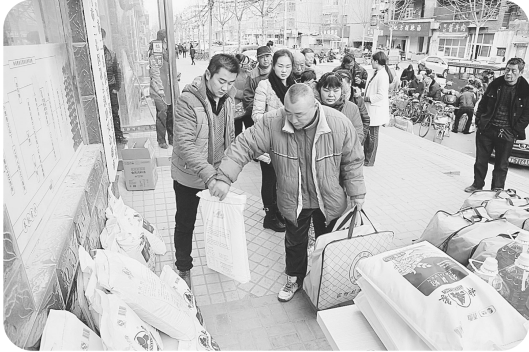
昨日,二七区民政局在保全街爱心超市为辖区特困低保户、因病致贫的家庭发放米、面、油、棉被等生活必需品。据了解,为了使辖区困难群众温暖过冬,二七区民政局将持续开展“爱心超市送年货”专项帮扶活动,为辖区特困家庭、贫困学生送去爱心年货。

截至目前,先行区内配备环卫工具箱20个,提前完成目标任务;更换垃圾箱10个,集中整治占道经营和突出店外经营300余起。