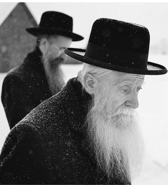
2005年1月25日，在波蘭南部的奧斯威辛集中營遺址，一名猶太幸存者（前）在同伴的陪同下，緬懷奧斯威辛集中營的遇難者。

有些記憶永不會忘記 一代代 一世世 經過無數風霜 那段灰暗歲月仍留給我們 無盡的悲痛 為着那些戰爭的犧牲者 讓那些悲傷化為力量