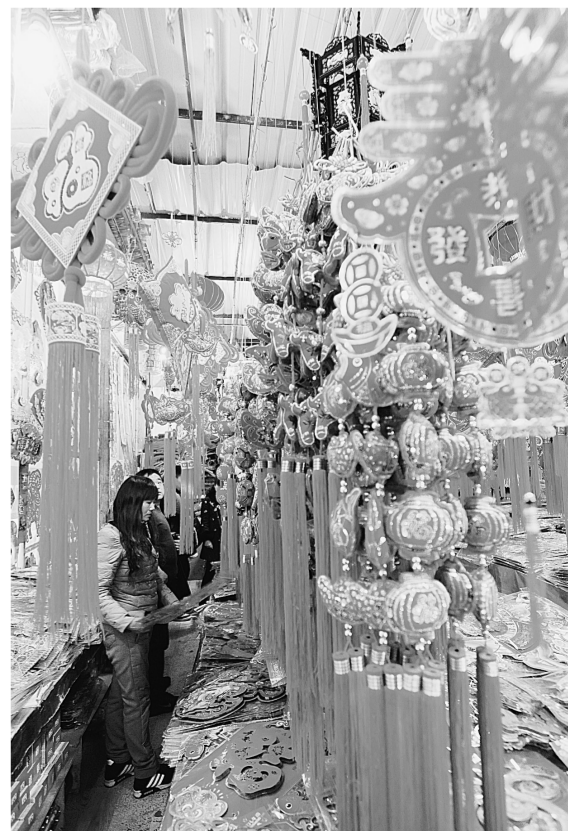
小饰品成为装点家居不可缺少的选择。

欲趁春节假日期间外出旅游的市民注意了,一定要与旅行社签订合同,明确约定旅游线路、游览的景点、食宿标准、旅游时间、交通工具等事项,同时还要明确购物次数和时间,并要保留有效票据,如出现纠纷,及时与经营者协商解决,或直接向被诉方所在地的旅游部门投诉。