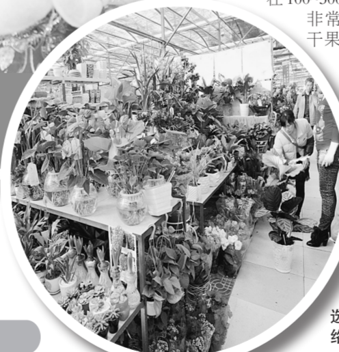
前来花卉市场选购鲜花的市民络绎不绝。