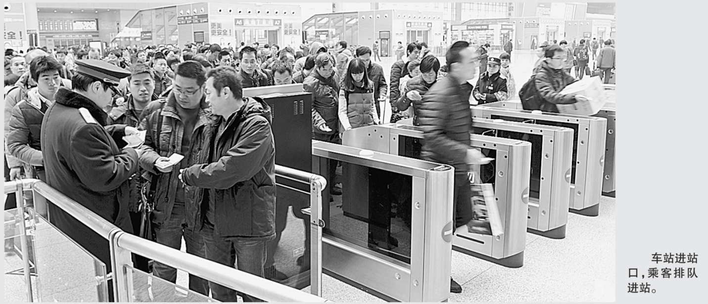
车站进站口,乘客排队进站。

火车站里携家带口的归乡人、公园广场高挂的大红灯笼、商场超市欢快的“新年好”歌曲……一幕幕熟悉的场景,一年中对中国人来说最重要的节日——春节,渐行渐近。离除夕不到10天,回家、过节,成为人们两个最大的诉求。连日来,记者兵分多路,来到车站、商场、餐饮机构等多地探访,为您奉上节日出行吃喝、游购娱乐全攻略。