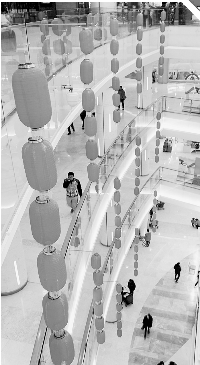
各大商场挂起了增添节日气氛的红灯笼。