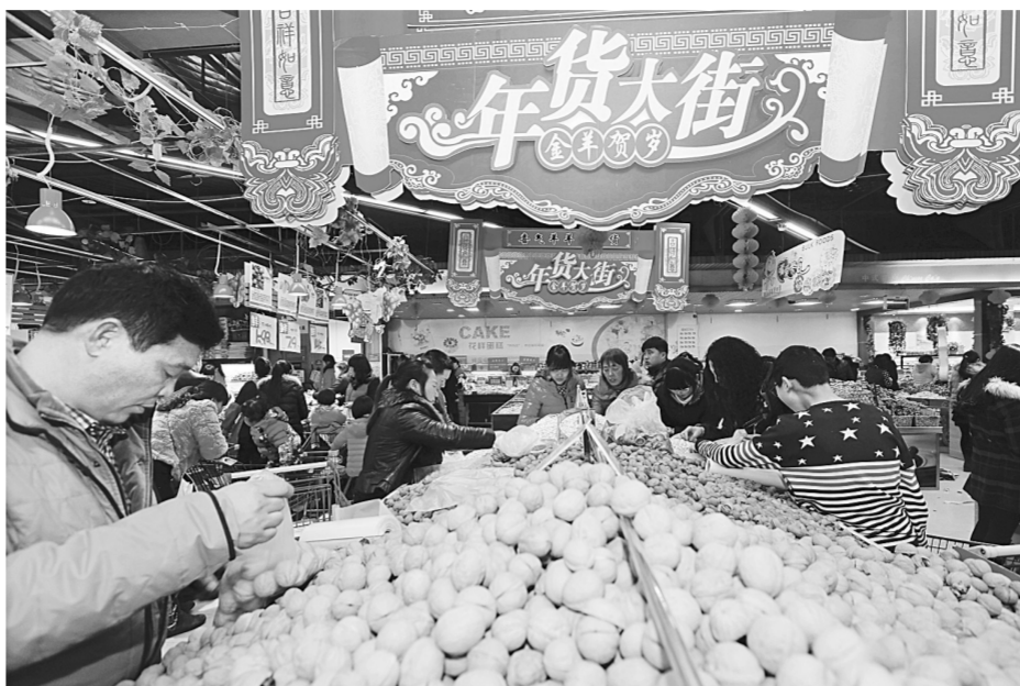
新郑市民在超市选购年货。

情人节赶在春节前,浪漫消费也走俏。以往春节,受市民欢迎的是盆栽花卉。而今年情人节恰好赶在了春节前夕,因此商家还准备了大量的鲜花花束、鲜花礼盒,推出浪漫消费。而这种浪漫消费不体现在鲜花店,在新郑市各家西餐厅,记者也抢先看到了各种情侣套餐。