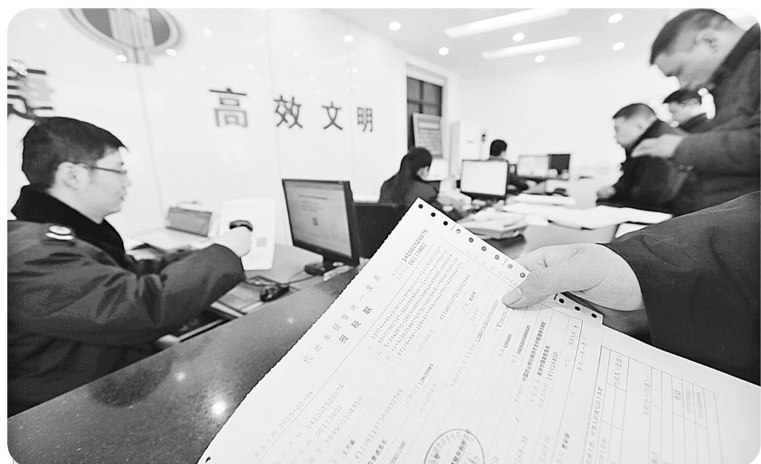
新郑市国税局办事大厅工作人员在扫描车辆合格证,为市民办理车辆购置税。

从申报车辆购置税的车辆价格结构看,10万元以下的汽车有11281台,10万元至20万元的汽车有5335台,20万元以上的汽车有1625台。与2013年相比,申报车辆数同比增长28%,缴纳税款额同比增长43%。2015年1月,更是创下了单月申报车辆购置税2407台、税款2238万元的新高。