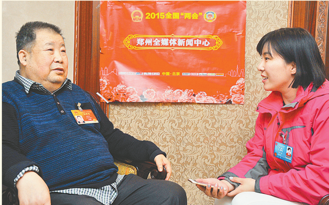
全国人大代表凌解放(二月河)接受郑州全媒体新闻中心两会记者专访。