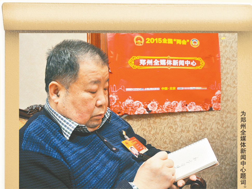
为郑州全媒体新闻中心题词。