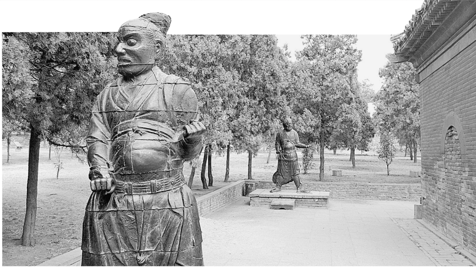
屹立在古神库四隅的铁人。