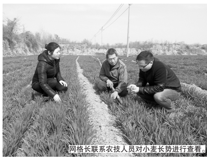
网格长联系农技人员对小麦长势进行查看。

针对春季小麦进入拔节的关健时期,王村镇以二级网格为单位,通过出动宣传车、发放宣传页等形式,宣传麦田后期管理技术知识,引导农民科学管理。一级网格组织农技人员深入村组、田间地头进行指导服务,做到技术指导到户,技术服务到田,现场帮助解决麦田管理难题。针对小麦蚜虫、麦田红蜘蛛等病虫害,镇农业服务中心积极筹备农药物资,由网格长及时分发到户,开展病虫害防治。