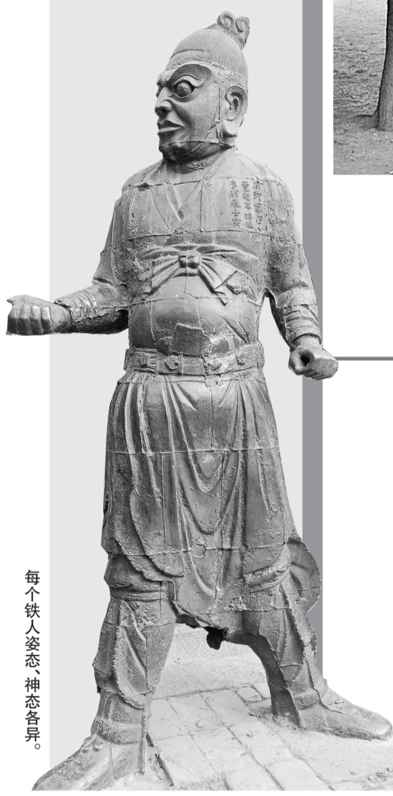
每个铁人姿态、神态各异。

时过惊蛰,乍暖还寒。一层薄雾笼罩下的中岳庙若隐若现,行走在被世人所熟知的这座道教圣地内,苍松翠柏间自有一番静意。从崇圣门进,沿石径前行,东北方向便到了此次探访的目标——镇库铁人。振臂握拳、昂首挺胸,屹立在古神库四隅的铁人令人眼前一亮。