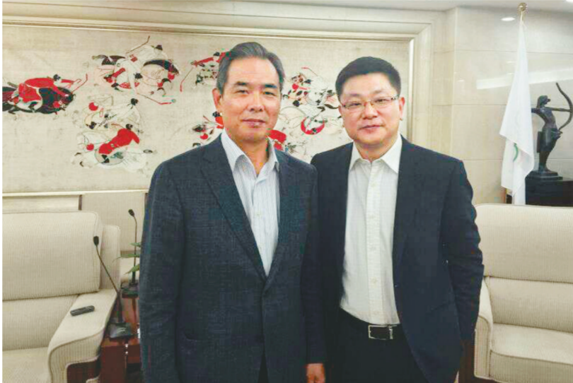
蔡振华(左)与古兵合影。

中国足球改革描绘未来大方向，世界强队、顶级联赛、办世界杯、进奥运会……《面对面》专访中国足协主席蔡振华。