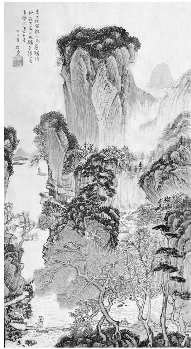
万木经霜似似花(国画) 李敬萱

编辑 李昊 校对 屠会新 电话 56568225 Email: zrbzfb@163.com