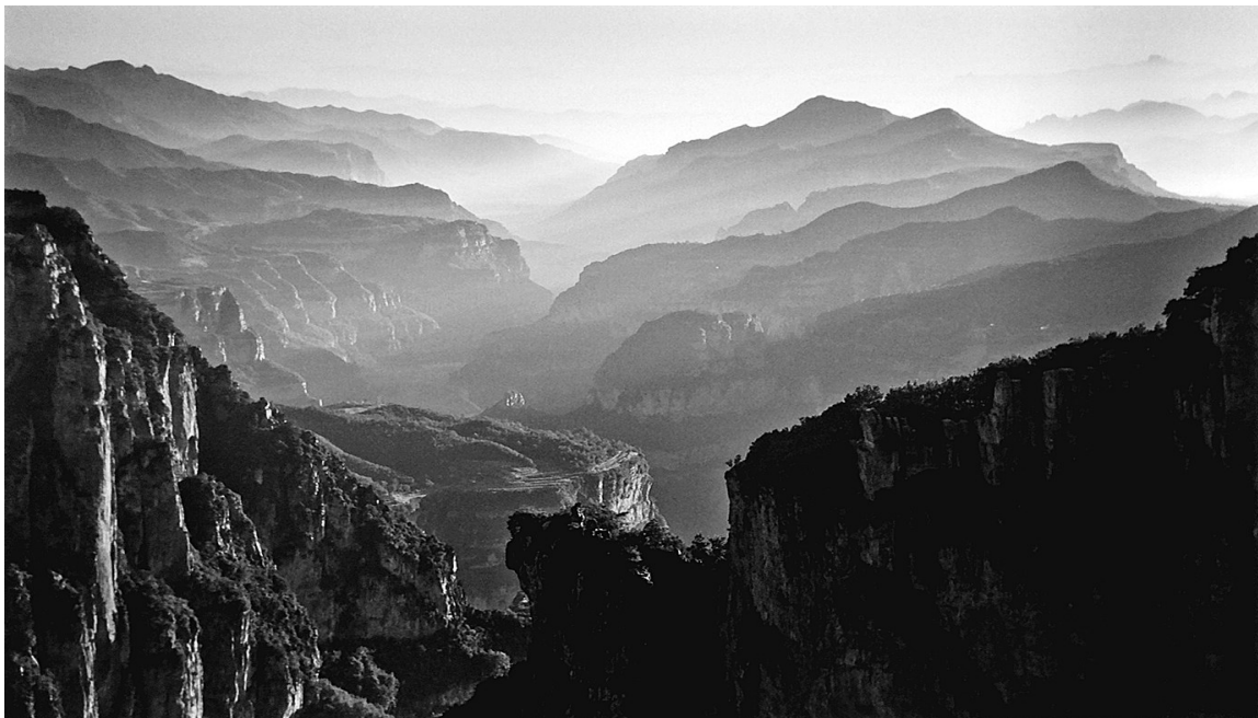
太行晨晖

这套“四弦散谈”是写给青年知识分子的人生启示录，将当下读者最关注的四个主题：心理与健康、教养与关系、经历与成长、生命与死亡，聚焦进了《心理医生附耳细说》《教养的关系花园》《我喜欢辽阔的地方》《写下你的墓志铭》这四本书中。书中的故事大都是作家毕淑敏亲历的人生，以其妙笔跃然纸上，多元的知识和敏锐感知写出的文字，温婉而直指人心。毕淑敏在生命不同阶段对人生各种问题的思考，读者顺着读下去，眼前渐次看到的是她“跌宕新奇、开阔而真诚”的人生地图。她的经历无法复制和效仿，但她面对人生的态度和理性却不失温暖的智慧，是给今天的青年人最宝贵的启示。