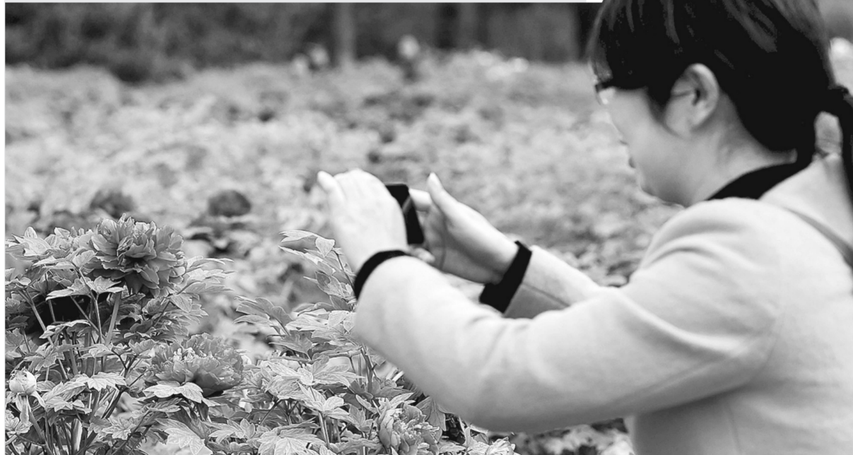
4月2日，在河南洛陽市中國花園，大面積牡丹綻放，吸引了不少游人前來觀賞游玩。圖為遊客在洛陽中國花園內拍攝牡丹花。