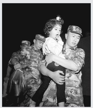
4月2日,在吉布提共和国吉布提港,中国海军临海舰的舰员抱着一名外籍儿童走下舷梯。

据新华社北京4月3日电(记者 朱佳妮 张媛)外交部发言人华春莹3日在例行记者会上回答记者提问时表示,日前中方协助撤离巴基斯坦等10国在也门公民,是中国政府首次为撤离处于危险地区的外国公民采取的专门行动。