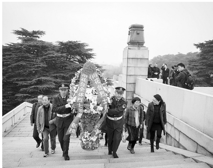
4月3日,100多名来自北京、江苏、安徽、浙江等地的烈士亲属来到南京雨花台烈士陵园,为亲人献上花圈,表达哀思。