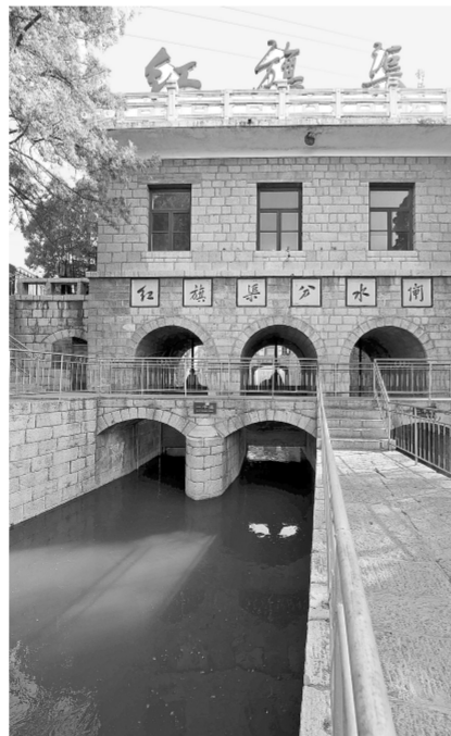
这是3月23日拍摄的红旗渠分水闸。

红旗渠工程于1960年2月动工,1965年4月5日总干渠通水,是当时林县(今林州市)人民为了解决用水问题,在极其艰苦的条件下,从太行山山腰修建的引漳入林的人工水利工程。红旗渠总干渠渠高4.3米,渠底宽8米,长70.6公里,以浊漳河为源,将漳河水引入林州。当时施工条件艰苦,缺少机械设备,林县人民自力更生、艰苦奋斗,用最普通的工具,劈开太行山,凿密悬崖,引漳河水入林县,建成“人造天河”红旗渠。