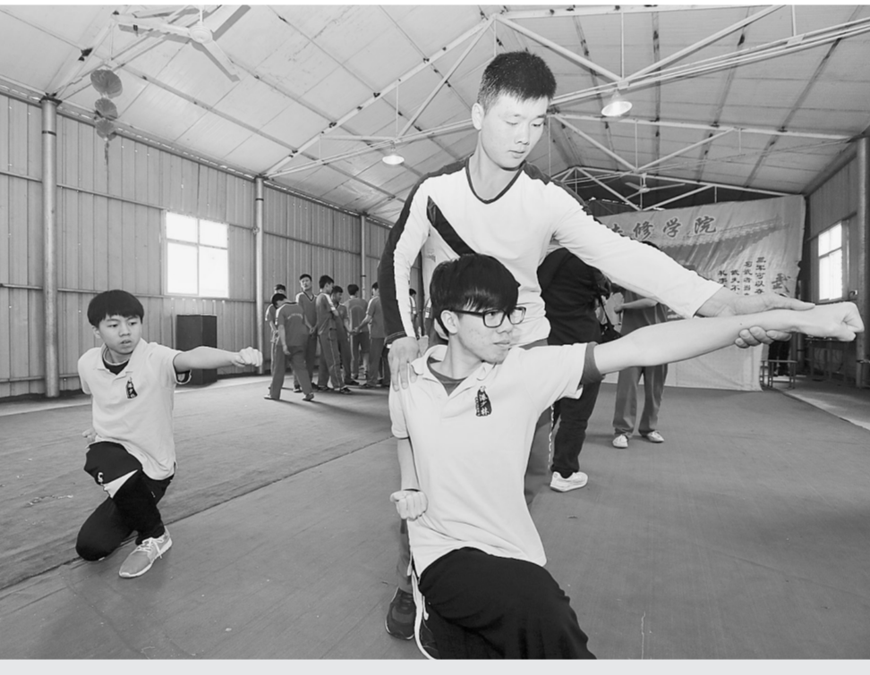
4月3日,香港武术文化研修中心、香港邓肇坚维多利亚官立中学代表团一行10余人来到郑州少林武术专修学院新郑惠光武院就少林武术与黄帝文化的结合与发展进行交流。图为两校学生在相互切磋交流。

新郑市人民路魏丽鞋柜营业执照注销(证号410184600203625),声明作废。