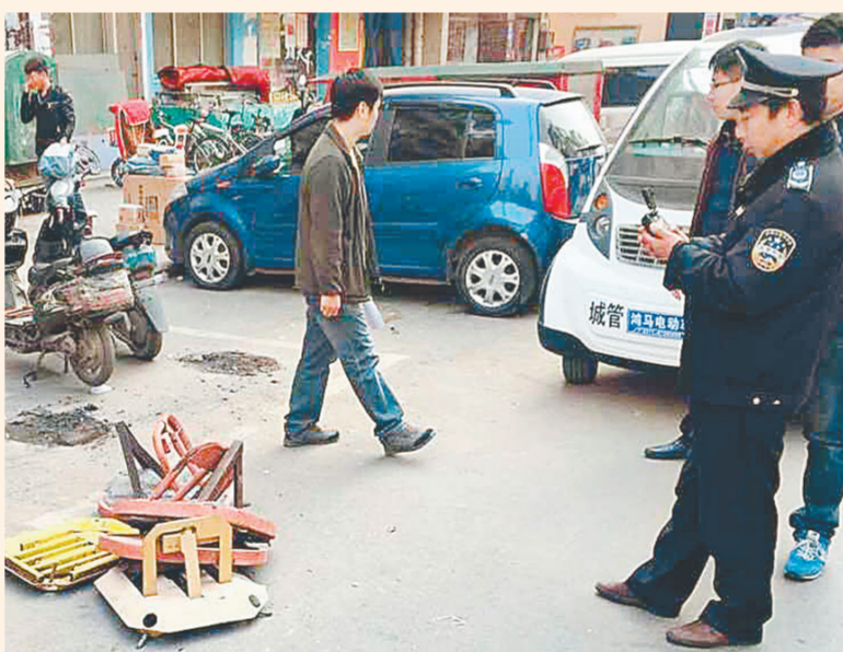
北下街办事处与行政执法中队联合拆除管城后街上的私装地锁。