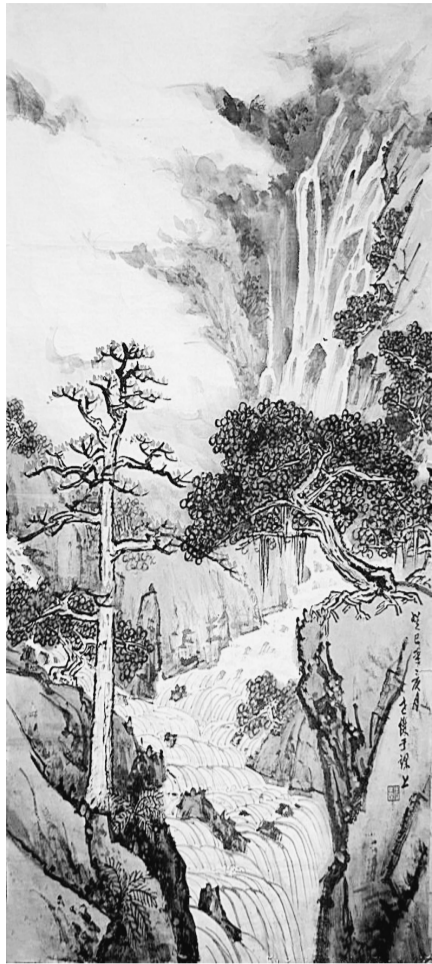
高山流水(国画) 张世杰