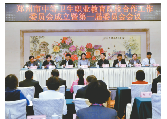
近日,市卫生学校主办的“郑州市中等卫生职业教育院校合作工作委员会成立大会暨第一届委员会会议”在我市召开。

本报讯(记者 汪辉 王治)日前,记者从郑大三附院获悉,该院为进一步广开言路、问计于民,鼓励社会各界针对该院医疗服务、就诊环境、学科建设、人才引进、医院发展等方面提建议、献良策,该院将开展“我为百姓健康,百姓为我献良策”活动。 据介绍,作为回报,每位向该院提出建议的人员均能享受口腔疾病免费筛查一次,可免费参加医院孕妇课堂及院内各类健康知识科普讲座;建议一旦被采纳,将获得该院提供的价值500元健康体检卡一张。