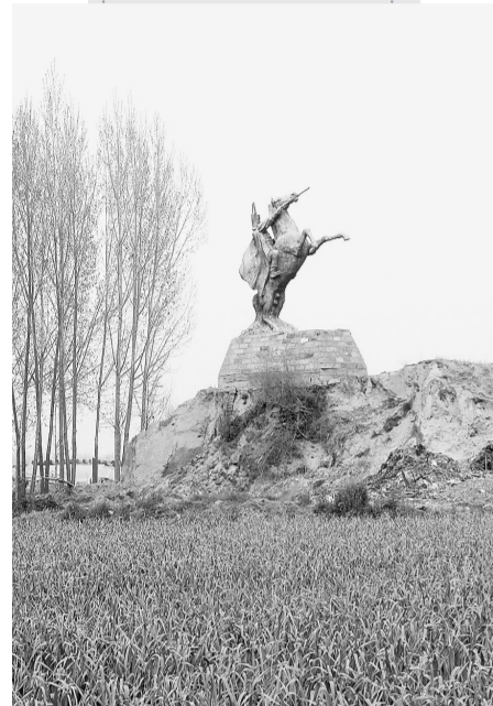
逐鹿营村北的曹公台