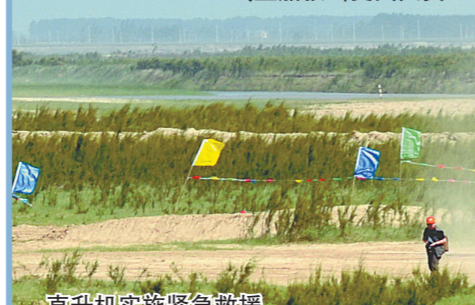
直升机实施紧急救援