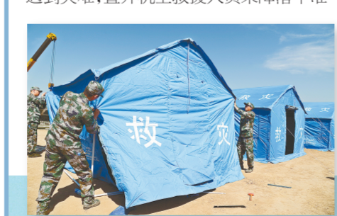
紧急搭起安置帐篷

演练科目齐全,内容丰富。这边厢,水中救援正在进行,水陆通用的气垫船将“遇灾”群众有序救出;那边厢,山体滑坡、消防战士沉着列队,将“受困人员”安全送回地面;不远处,一场大火爆发,白烟滚滚,小型飞机迅速行动,空中灭火效果显著,工作人员紧急为“受灾群众”搭帐篷;遇到灾难,直升机上救援人员乘降落伞准