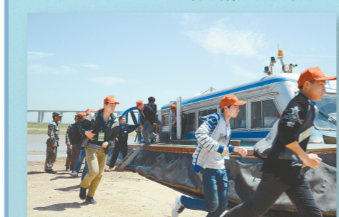
气垫船救出受困人员