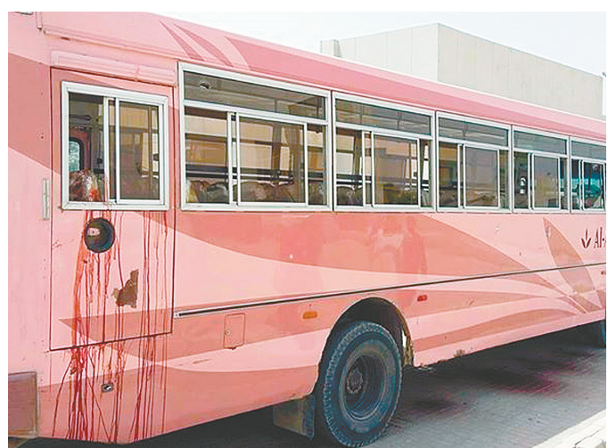
图为5月13日巴基斯坦南部城市卡拉奇遇袭公交车

新华社伊斯兰堡5月13日电(记者 王玉 张琪)巴基斯坦警方13日说,巴南部城市卡拉奇一辆公共汽车当天上午遭不明身份枪手袭击,造成至少43人死亡、13人受伤。