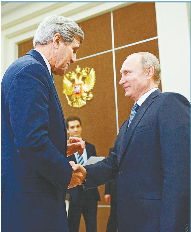
5月12日,在俄罗斯索契,美国国务卿克里(左)与俄罗斯总统普京在会谈后握手。