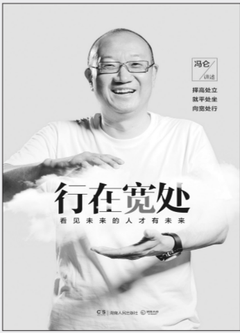
行在宽处 做未来的人才有未来

另外,我前面讲过,我们这些从海南出来的人,都面临着学好还是学坏的问题。学好就要花钱。史玉柱认为好人就是不能赖账,该给人家钱就要给。所以,史玉柱活下来了。如果你该给的钱不给,能赖账的就赖账,赖不掉就躲,躲不了就跑,那你的公司还能存在吗?如果你不纳税,不分工,不给员工发工资,不还银行的钱,你想,会有多少人追着你讨债,折腾你,你还拿什么决胜未来?反过来,如果你的价值观是对的,它就会引导你不断地做好人。你老给股东分红,股东就觉得你很好;你按时给员工发工资发奖金,员工在你这儿就很开心;政府看你纳税,就支持你;银行看你还贷,下次还愿意借钱给你。这样,你就能不断得到大家的支持,一步步向前发展。做好人还是做坏人,只是你脑子里的