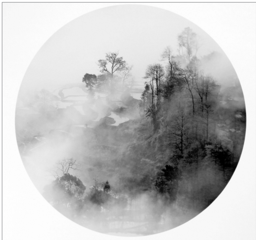
天光云影

三心二意地写作,漫无目的地投稿,不为糊口地发表,花钱受累地集结,仅看书名,算是作者杂文随笔集的“三心二意”系列吧。(节自作者新书《天意人间》自序)