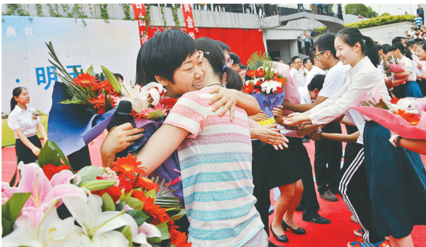
昨日,郑州市第一中学举办了2015级学生毕业典礼。仪式上,现在北京就读的往届同学与学弟学妹们分享了学习方法,高三班主任为毕业生们送上美好祝福。

合福高铁是京福高铁的重要组成部分,是我国继京津、武广、郑西高铁之后,又一条设计时速为300公里的双线电气化高速铁路。据悉,除了黄山外,合福高铁沿线旅游景点还有婺源、武夷山、南靖土楼、厦门鼓浪屿和三清山等,有“全国最美高铁线”之称。