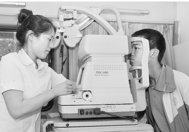
在市三十一中现场为中学生提供免费视力检测、验光咨询、眼镜清洗等多项服务。

政府在其中扮演重要角色,如何防范权力寻租,成为社会关注的焦点。有专家反映,政府出手购买商品房,这体现了分类调控的思路,也在一定程度上化解了库存,但究竟效果如何,还有待继续观察。