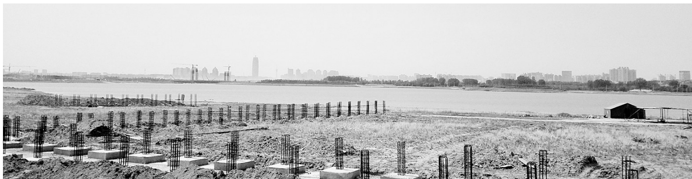
从龙湖西商业区的游艇码头可以望到如意湖的“大玉米”