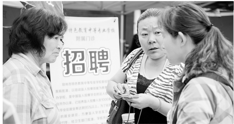
昨日,郑州市残疾人千人上岗就业创业启动仪式在市残疾人劳动就业服务中心举行,随后举办了残疾人就业现场招聘会,20多家企业提供岗位1300多个,涉及餐饮服务、电子商务等。市残联将通过招聘会、企业学校对接等形式,力争半年时间,帮助千名以上残疾人实现就业创业。

郑州大学录取执行国家规定的高考加分政策,对于进档考生的专业安排,采用分数级差办法。