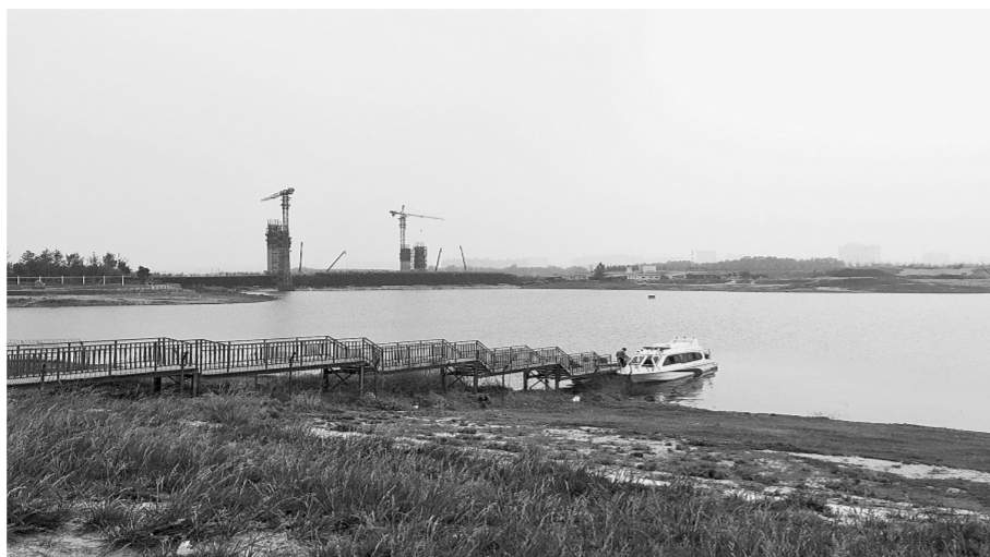
乘坐游艇逛龙湖将会有更好的体验

为了向社会公众提供便利服务,郑东新区管委会还将在龙湖水域保护区内设置全民健身器材、游览导向牌、无障碍设施、直饮水站(点)等配套设施。此外,为了保证龙湖区域的水质,郑东新区管委会将组织设置水质监测体系,建立水质预警机制,定期监测龙湖水域水质,并将监测结果及时向社会公布。一旦龙湖水域水质有异常变化,郑东新区环境保护机构应当及时调查、处理。