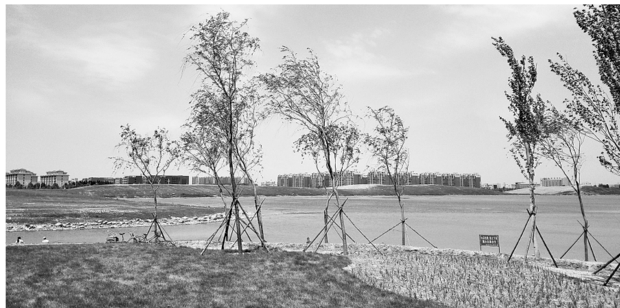
龙子湖已经成为市民休闲的好去处