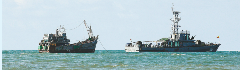
5月31日,在缅甸勒岛附近海域,偷渡船只(左)被缅甸海军舰艇控制。一艘满载700多名偷渡客的船只3天前被缅甸海军在安达曼海上发现并截获,目前被缅甸海军控制不得靠岸。