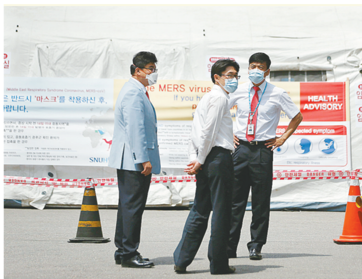
6月2日,在韩国首尔一家医院,工作人员站在隔离区前。

另据沙特卫生部1日通报,该国首都利雅得某医院收治的一名41岁外籍人士死于中东呼吸综合征,另有两名沙特东部居民被确诊为该病新增患者。