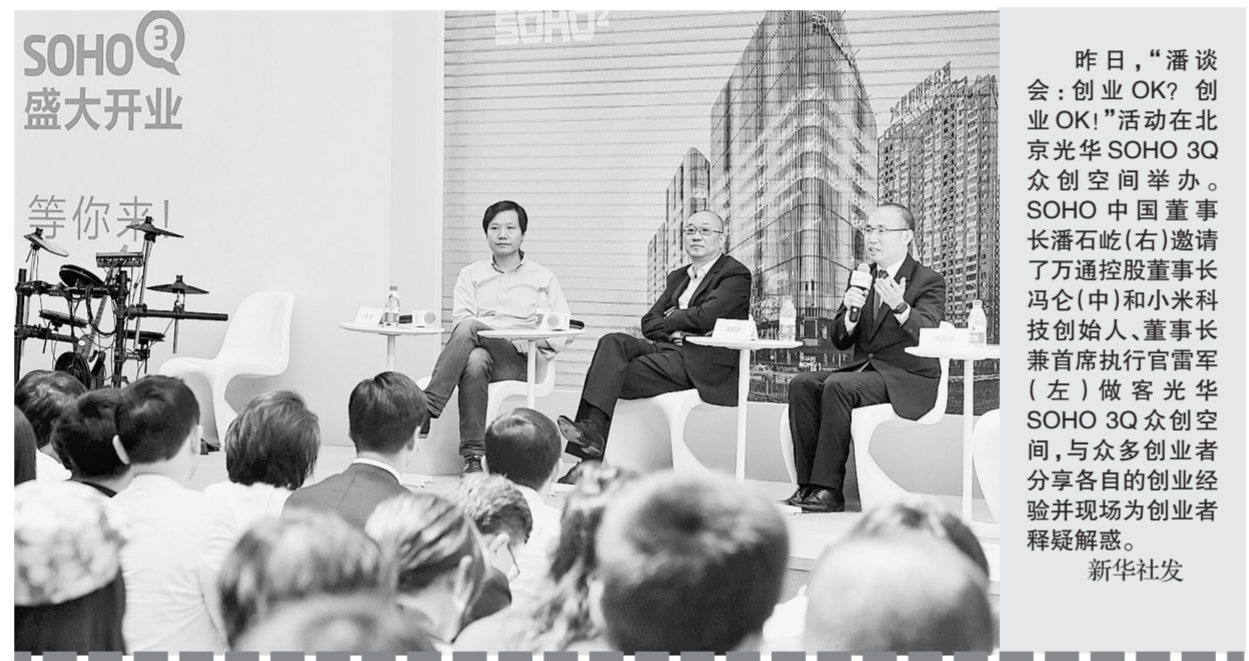
昨日,“潘谈会:创业OK?创业OK!”活动在北京光华SOHO 3Q众创空间举办。SOHO中国董事长潘石屹(右)邀请了万通控股董事长冯仑(中)和小米科技创始人、董事长兼首席执行官雷军(左)做客光华SOHO 3Q众创空间,与众多创业者分享各自的创业经验并现场为创业者答疑解惑。

实施升级改造项目22项,到2016年底,中石油集团汽、柴油将全部达到国V标准要求。此外,中石油将加强技术研发,完善配套“京VI”和“国VI”标准的清洁汽柴油生产装置和设施研究。