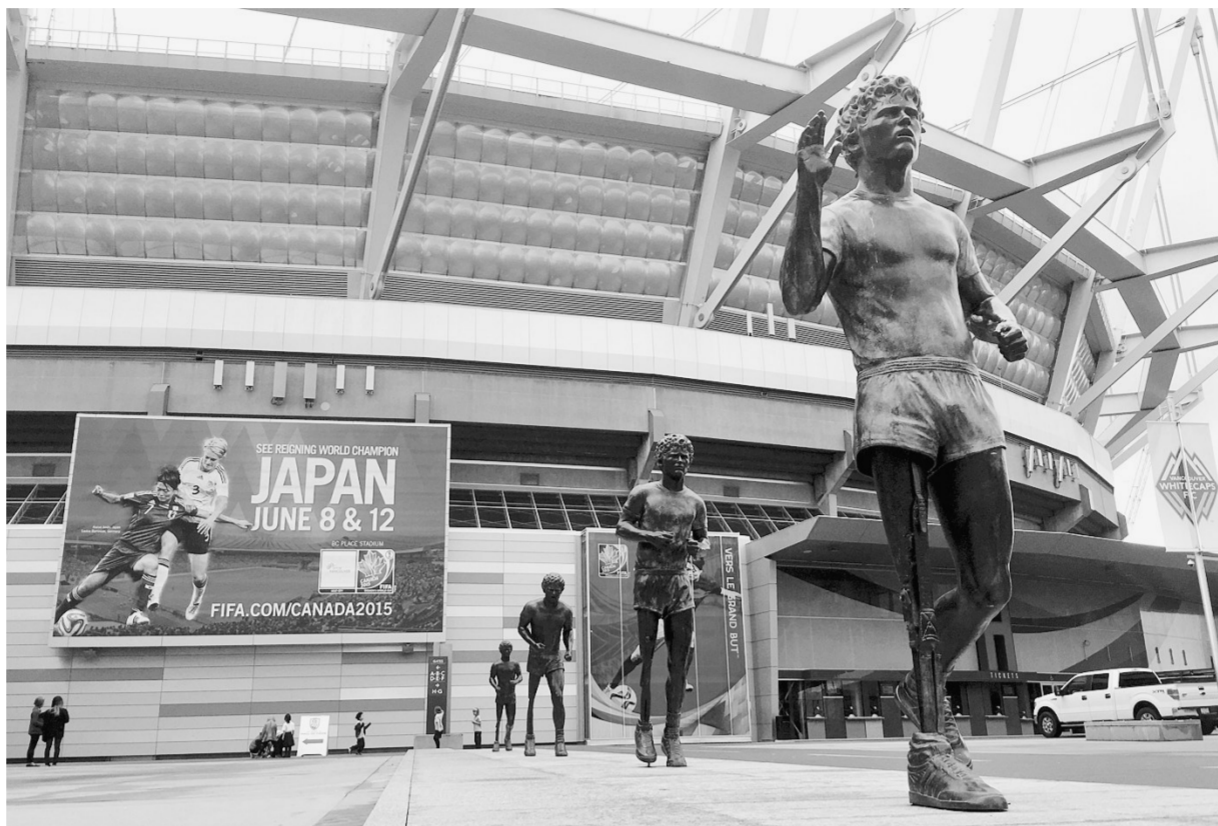
第七届女足世界杯将于6月6日至7月5日在加拿大的六个城市举行，最终的决赛将在温哥华举行。作为加拿大第三大城市，温哥华是加拿大西海岸最大的工商、金融、科技和文化中心。图为6月2日拍摄的本届女足世界杯决赛场地——温哥华BC体育场外景。

面对世界排名高于自己，还是东道主的加拿大队，中国队显然处在较低的心理位置，这未尝不是一件好事。家门口的世界杯在揭幕战上肯定要承受较大的心理压力，而以挑战者身份出现、没有任何世界杯经验的中国女足姑娘们，只要不怯场，尽情地挥洒，无论结果如何，都将赢得世界的尊重。