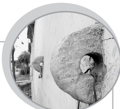
张家古宅门前的拴马石