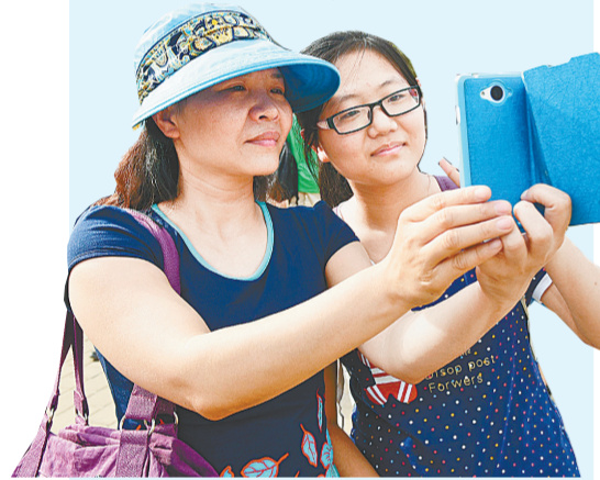
考试结束合影留念

6月25日零时公布成绩及分数线,考生可登录河南省教育厅网站(http://www.haedu.gov.cn)、河南省招生办公室网站(http://www.heao.gov.cn)、河南招生考试信息网(http://www.hnca.com.cn)、河南省普通高校毕业生就业服务平台(http://pzwb.heao.gov.cn)网上查询。