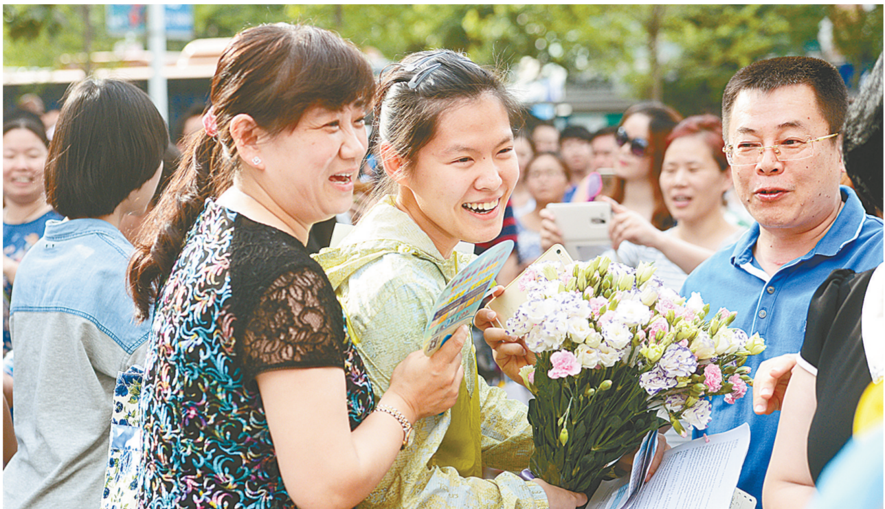
走出考场放松心情