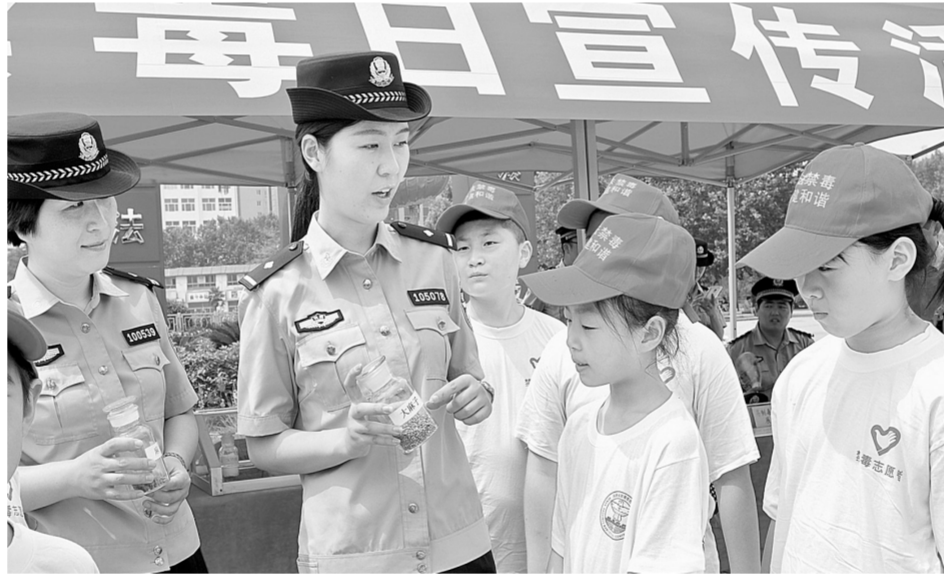
民警结合实例,向禁毒小志愿者们讲解毒品的危害等知识。

本报讯(记者 王译博 文)昨日,郑州警方在绿城广场举行“抵制毒品 参与禁毒”大型广场宣传活动。