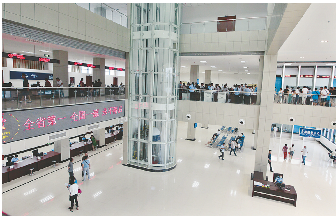
车管所新建综合办事大厅昨日正式投用,开始对外办理业务。

本报讯(记者 王译博 通讯员 赵峥 文/图)昨日,记者从车管所了解到,车管所新建综合办事大厅6月29日正式对外办理业务。