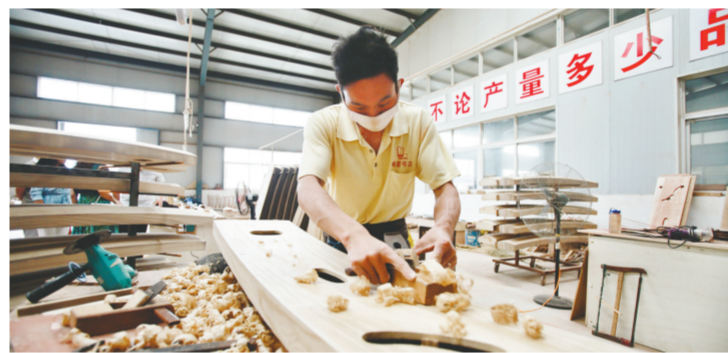
民族乐器制作形成完整产业链