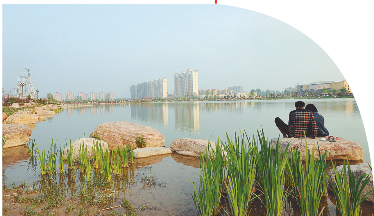
兰阳湖公园成为群众休闲娱乐的新去处