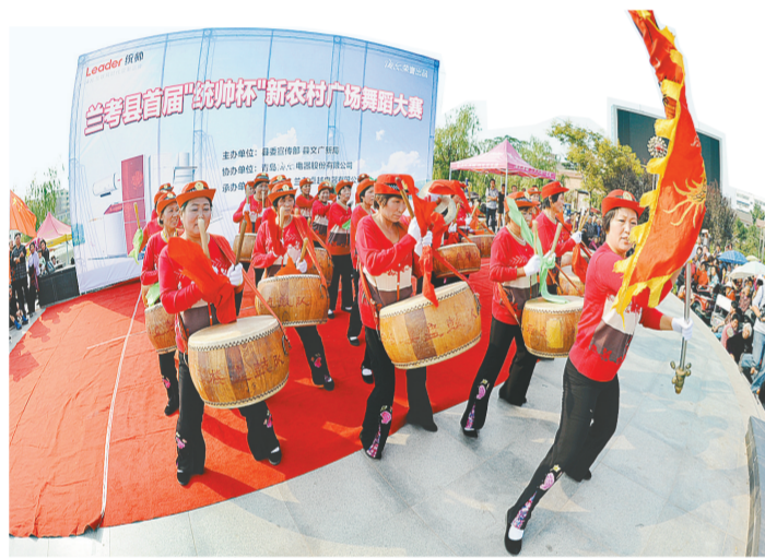
日益丰富的群众文化生活