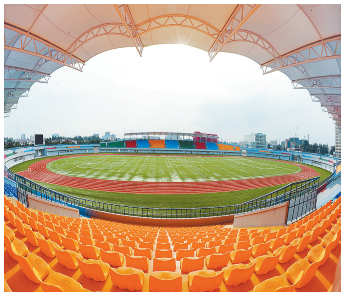
现代化的体育场馆提升了城市品位