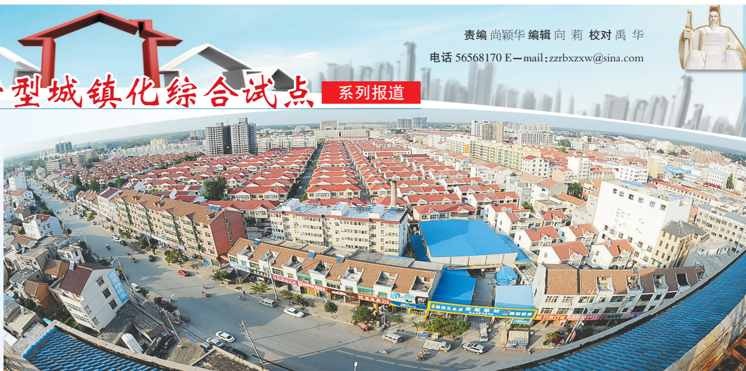
新型城镇化建设为兰考发展带来新的生机和活力

提及兰考,大多数人会首先联想起上世纪90年代那部家喻户晓的经典电影《焦裕禄》。这部电影让大家记住了焦裕禄亲民爱民、无私奉献的“人民好公仆”形象,也让人们看到了兰考贫穷、落后的一面,并且这样先入为主的印象在很长一段时间,在大家的意识中根深蒂固。