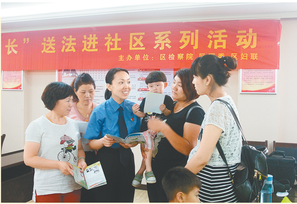
昨日，管城回族区检察院联合区团委、区妇联在紫荆社区共同举办“平安暑期，关爱成长”主题活动。