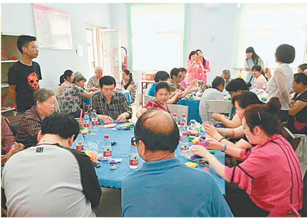
管城区残联、陇海马路街道残联昨日联合在郑新里社区残疾人康复工作站举办残疾人创业就业培训班。本次培训邀请手工艺制作专家向大家教授手工艺制作，30多位残疾朋友参加了培训。

村里的养鱼专业户会长会真心点赞：“这个培训班简直就是‘及时雨’，去年的那场季节性暴发病，一个鱼塘一夜之间能死掉千把斤鱼，我们又是心疼又是着急，看来，养鱼光靠‘老皇历’是不行了。”