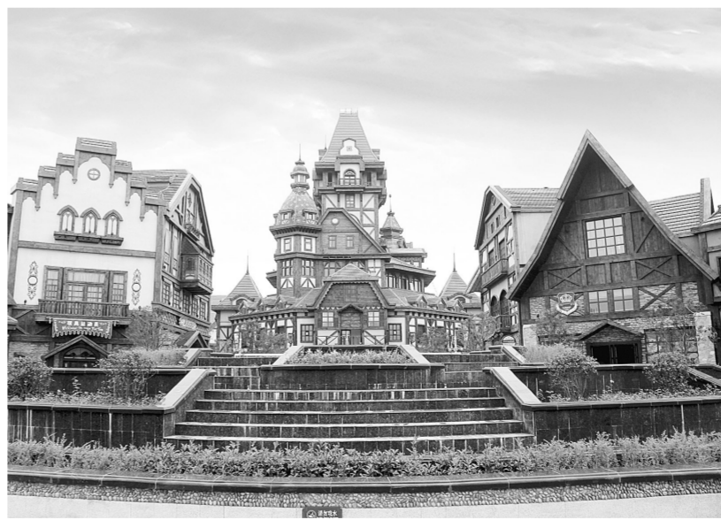
方特梦幻王国内的“欧洲街”

据了解，方特梦幻王国是以中国神话为背景的文化科技主题公园，将动漫卡通、电影特技等国际时尚娱乐元素与中国古典神话及中国文化元素巧妙融合，创造充满幻想和创意的神奇天地。公园由超大型室内游历探险项目——秦陵历险；跟踪式立体魔幻表演项目——魔法城堡；大型高科技水灾难体验项目——决战金山寺；现代大型主题高科技娱乐项目——西游传说；世界顶级木质过山车——丛林飞龙等20多个室内外项目组成，包含主题项目、游乐项目、休闲及景观项目共200余项。