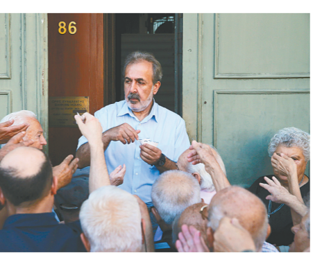
7月10日,在希腊首都雅典一家银行外,一名银行工作人员向养老金领取者发放领取养老金的凭证。