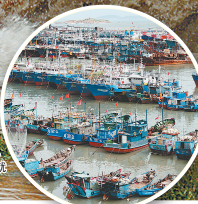
7月10日,连江县黄岐镇海坛村海域掀起巨浪。7月10日,众多船只在连江县黄岐中心渔港就近避风。

中央气象台10日早晨发布今年首个台风红色预警,预计超强台风“灿鸿”将于10日夜间到11日上午在浙闽沿海登陆。 中央气象台监测显示,今年第9号台风“灿鸿”于9日夜间加强为超强台风级,中心附近最大风力16级(52米/秒),10日早晨5时移入东海东南部海域。预计“灿鸿”将继续快速向西北方向移动,强度还将有所加强,将于10日夜间到11日上午在福建福鼎到浙江象山一带沿海登陆,登陆强度可达超强台风级或强台风级(15级-17级,48-58米/秒)。 受“灿鸿”影响,预计未来24小时,南海东北部、巴士海峡、台湾海峡、台湾以东洋面、东海大部海域、黄海南部海域以及钓鱼岛附近海域、长江口区、杭州湾、台湾东部和北部沿海、福建沿海、浙江沿海、上海沿海、江苏南部沿海将有7至10级大风,部分海域或地区风力可达11至14级,“灿鸿”中心经过的附近海面或地区的风力有15至17级,阵风可达17级以上。台湾中北部、福建东北部、浙江大部、上海、江苏东南部等地将有大雨或暴雨,其中浙江东部、台湾北部的部分地区有大暴雨(100毫米至250毫米);浙江东部沿海局地有特大暴雨(250毫米至300毫米)。