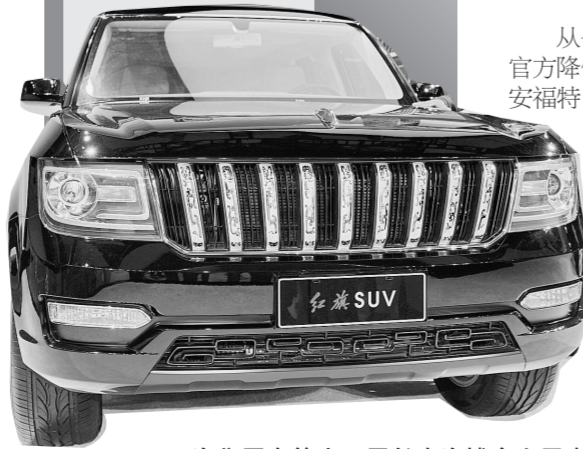
一汽集团在第十二届长春汽博会上展出红旗牌首款SUV车型LS5。据介绍,这款车有望在2016年上市。