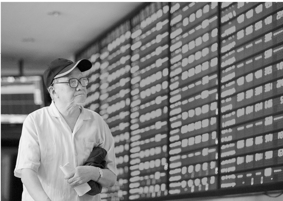
7月13日,股民在南京一证券营业厅关注股市行情。截至当日收盘,沪指报3970.39点,涨幅2.39%;深证成指报收于12614.16点,涨幅4.78%。

据新华社北京7月13日电 中国证监会新闻发言人邓舸13日晚间说,证监会13日组织稽查执法力量赴恒生电子股份有限公司,核查有关线索,监督相关各方严格执行证监会的相关规定。