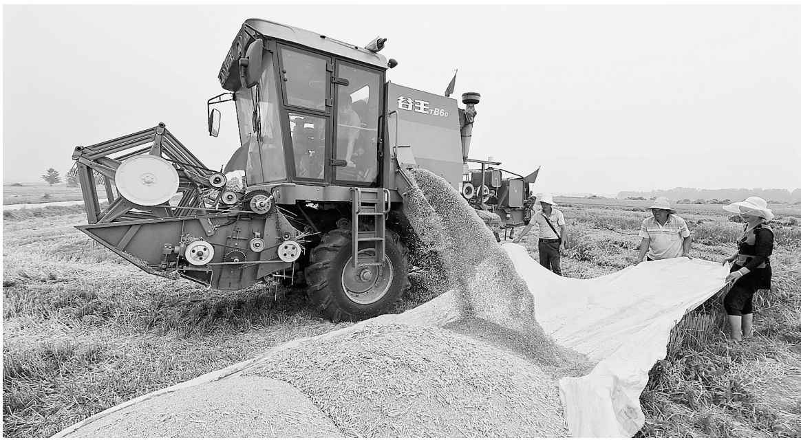
国家统计局河南调查总队7月15日发布数据,今年河南省夏粮总产量达702.36亿斤,实现连续13年增产。图为5月28日,一台收割机在濮阳市唐河县甘河湾村的麦田里卸装小麦。

河南省农业厅相关负责人表示,今年夏粮增产,得益于播种的面积增加和单产的提高。据了解,今年河南省夏粮播种面积达8178.5万亩,比上年增加0.3%,其中小麦播种面积8138.49万亩,比上年增加0.4%。今年小麦生长期,农业气象条件良好,小麦增产三因素呈现“两增一减”,夏粮单产较上年有所提高。