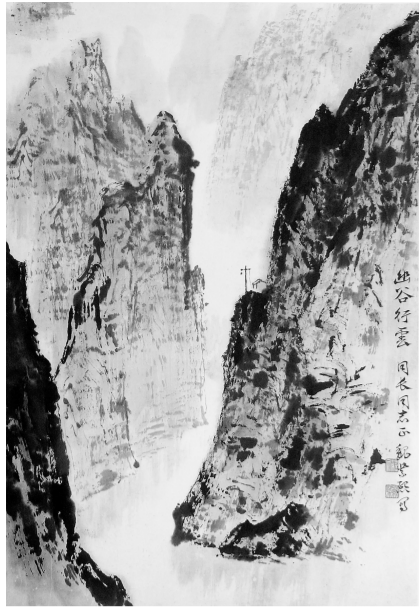
幽谷行云(国画) 魏紫熙