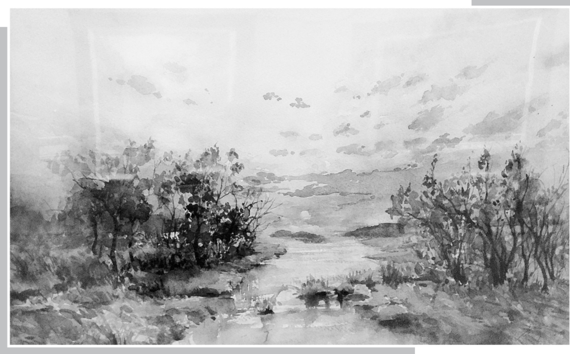
落日余晖(水彩) 李莹