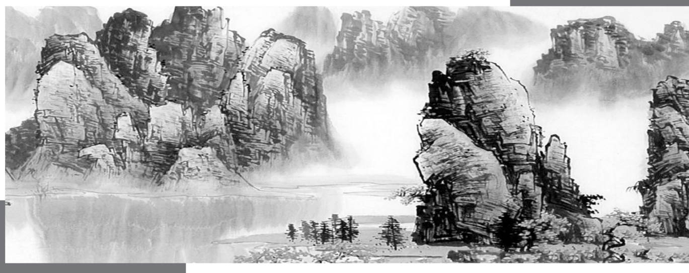
桂林山水(国画) 刘丽珍