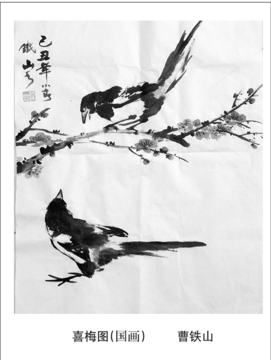
喜梅图(国画) 曹铁山