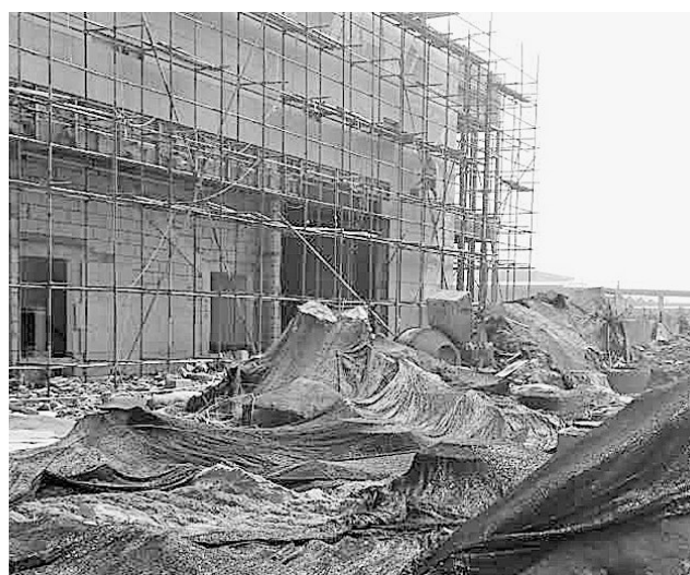
升龙广场项目施工现场，裸露部分已进行覆盖。

“对于不达标区域，我们立即整改，扬尘防治达标后才能恢复施工。”在鑫苑鑫城，施工方负责人表示，现在施工区域所有裸露黄土已全部覆盖。此外，组织大量人员和机械进行建筑材料和建筑垃圾的清运工作，保证在3日内全部完成。同时设专人进行已硬化施工工地的清扫和洒水作业，保持施工区的清洁和湿润，加强进出车辆管理，做到不带土上路。