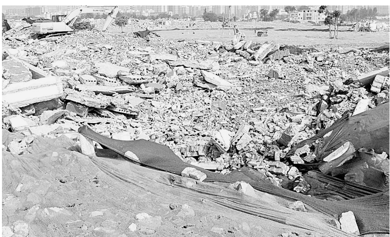
工地部分区域已盖上防尘网。

记者昨日回访发现，该工程西南侧拆迁工地一些建筑垃圾尚未清运，风吹过后，明显能看到空中飘着一层浮土。现场有工人正在铺设防尘网，一名工人说，三四天内即可覆盖到位。施工现场有多辆工程车，还有工人在拆卸混凝土内的废旧钢筋，作业前未洒水，震动引起的扬尘随风飘向周围。