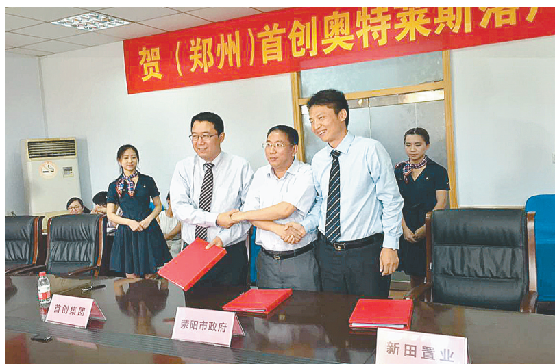
贺(郑州)首创奥特莱斯项目签约

优越的交通区位。如今,郑州市东西主干道陇海快速路直通新田大道,南部航海西路拓宽延伸,再加上郑上路、中原路、西四环、绕城高速、G310道路和郑东高速等交通要道,新田城业已形