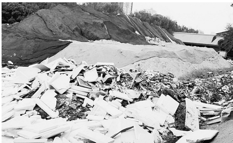
地铁2号线一期土建03工区,防尘网未覆盖严实,建筑垃圾裸露在外。

地铁2号线一期工程风水电施工03标段在金水河与紫荆山路交叉口东南侧,施工方为中铁十一局集团有限公司。该项目场区呈狭长形,多为地下工程。该工程前期因“存在冲洗设备