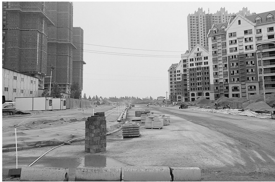
航空港区名门郡景周边道路设置喷淋设施抑制扬尘

昨日,郑州报业集团全媒体记者随同市场尘治理办公室督导组,走进新郑市、航空港区,对前期两地部分曝光工地进行回访,同时查看部分建筑扬尘治理情况。在走访过程中,记者了解到,先前经媒体曝光的建筑工