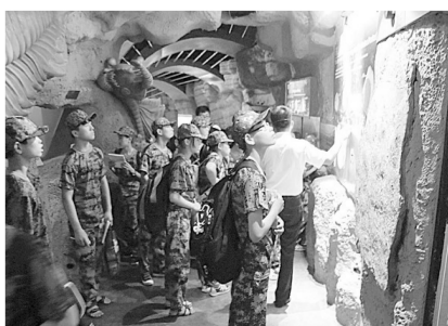
留守儿童在地质博物馆参观

记者了解到,“大美郑州文化中原”留守儿童夏令营项目也被列入“郑州慈善”微信募捐平台,市民可以关注公众号并为其进行捐赠。