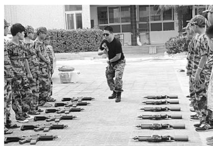
留守儿童第一次玩真人CS

8月6日至8日,记者随同郑州慈善总会相关负责人、小水滴志愿者团队一起,和来自全省的32名留守儿童度过了一个难忘的夏令营。