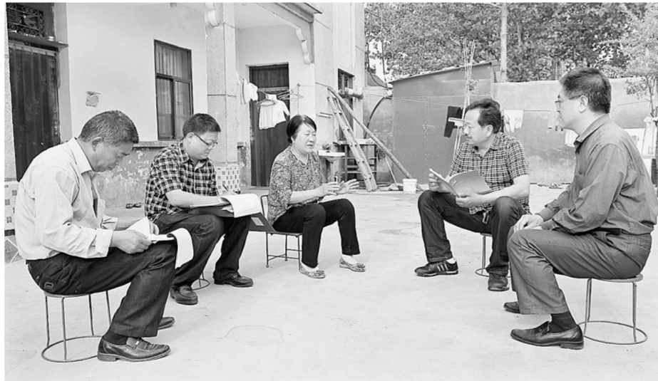
网格员入村与群众交谈,了解社情民意。

(上接T1版)除了依托网格化管理建立“横向到边,纵向到底”的排查体系,为实现矛盾纠纷的“内部消化”,新郑在全省首创了“1+3+1”矛盾化解模式,即在每一个二级网格内配备1个“法律明白人”,3名人民调解员和1名律师或法律工作者,既实现了矛盾纠纷“小事不出村组,大事不出乡镇”,又让群众掌握了法律常识,增强了法律观念。