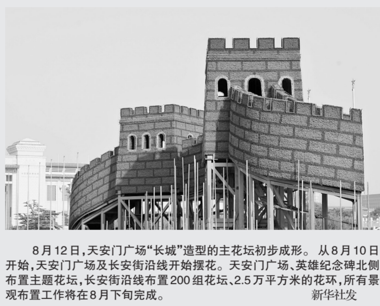
8月12日,天安门广场“长城”造型的主花坛初步成形。从8月10日开始,天安门广场及长安街沿线开始摆花。天安门广场、英雄纪念碑北侧布置主题花坛,长安街沿线布置200组花坛、2.5万平方米的花环,所有景观布置工作将在8月下旬完成。