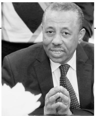
利比亚临时政府总理阿卜杜拉·萨尼(资料照片)8月12日在接受一家电视台采访时说,他将辞去总理职务。

利比亚临时政府 总理宣布辞职 利比亚临时政府总理阿卜杜拉·萨尼(资料照片)8月12日在接受一家电视台采访时说,他将辞去总理职务。