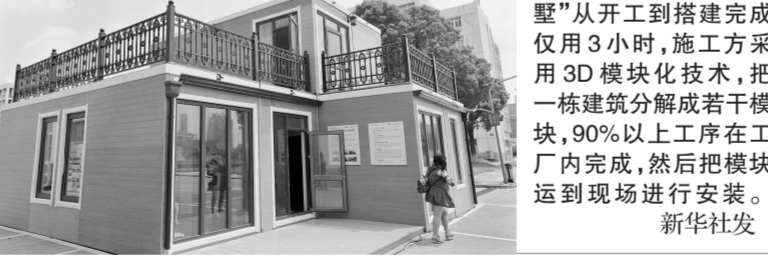
日前,一栋造价约30万元、面积110平方米的“别墅”在江苏南通职业学校园亮相。据了解,该“别墅”从开工到搭建完成仅用3小时,施工方采用3D模块化技术,把一栋建筑分解成若干模块,90%以上工序在工厂内完成,然后把模块运到施工现场进行安装。