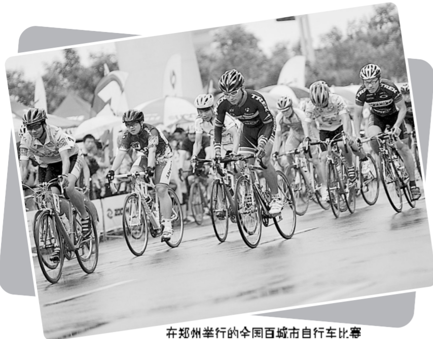
在郑州举行的全国百城市自行车比赛

产业基础更加坚实。公共体育设施遍布城乡,人均体育场地面积力争达到2平方米,体育公共服务基本覆盖全民,群众健身和消费意识显著增强,人均体育消费支出明显提高,经常参加体育锻炼的人数达到4000万人。从现在开始,体育即将跨入一个全新的融合时代,未来的体育将与文化、旅游、健康、养生、康复、住宅、商业等各行各业深度融合。