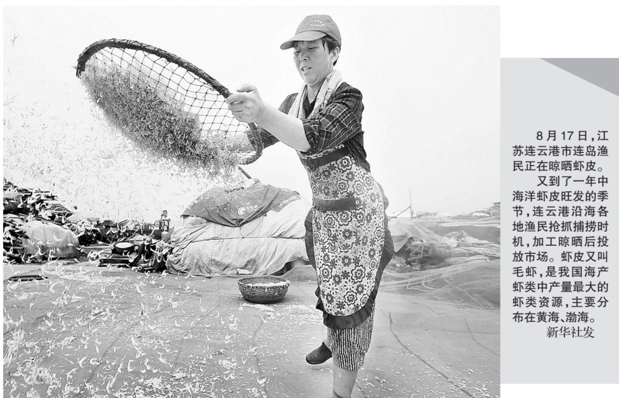
8月17日,江苏连云港市连岛渔民正在晾晒虾皮。又到了一年中海洋虾皮旺发的季节,连云港沿海各地渔民抢抓捕捞时机,加工晾晒后投放市场。虾皮又叫毛虾,是我国海产虾类中产量最大的虾类资源,主要分布在黄海、渤海。

报告显示,分险种看,2014年我国互联网财产保险保费收入505.7亿元,同比增长114%;人身保险保费收入353.2亿元,同比增长5.5倍,3年间年均增长率达到225%。