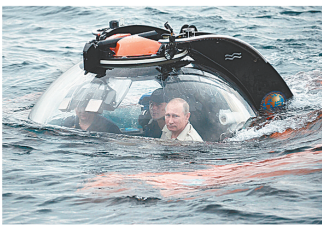
俄罗斯总统普京乘坐的潜水艇潜入水中。

这已经不是普京第一次深入海底探险。法新社报道,2009年,普京乘潜艇潜入贝加尔湖湖面以下大约1400米处;2011年,他参观塔曼半岛考古发掘现场时,身穿潜水服亲自潜水察看被称为“俄罗斯的亚特兰蒂斯”的法纳